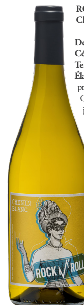
ROCK 'N' ROLL Chenin Blanc