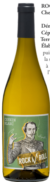
ROCK 'N' ROLL Chenin Blanc

Le Château de La Mulonnière, construit à l'époque de Napoléon III, fut jadis occupé par des habitants aux caractères bien trempés. À tel point que ces derniers se sont invités sur nos étiquettes, prenant au passage quelques libertés pour extérioriser leur personnalité extravertie. En bons châtelains qu'ils sont, voici donc Auguste, Agathe, Alfred et Anna, tous quatre impatients de découvrir votre palais.