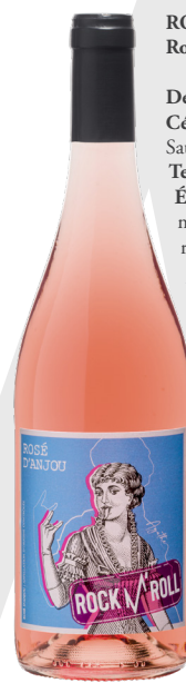
ROCK 'N' ROLL Rosé d'Anjou