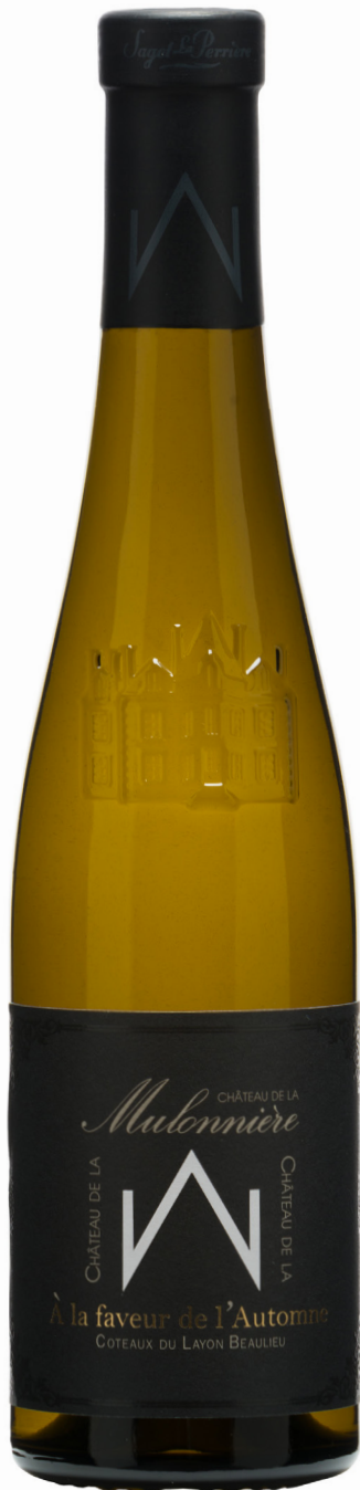
COTEAUX DU LAYON BEAULIEU - 37,5 cl « A la Faveur de l'Automne »