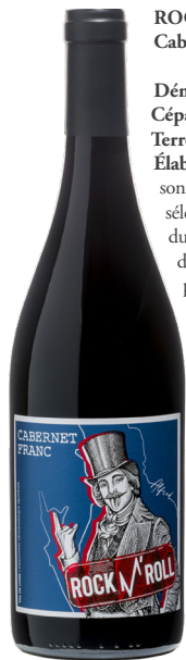
ROCK 'N' ROLL Cabernet Franc