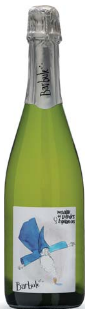
Crémant de Loire Barbule Touraine