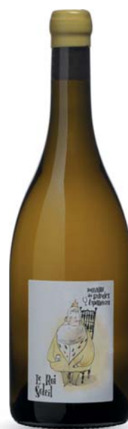
Touraine Le Roi Soleil