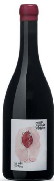
Les Ailes Pourpres