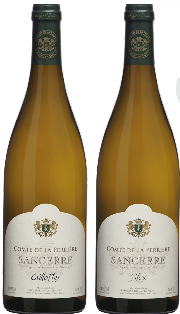
Sancerre Caillottes 2012 et Silex 2012 Domaine de la Perrière