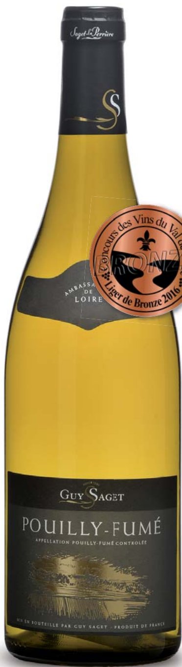
Pouilly-Fumé 2015 Guy Saget