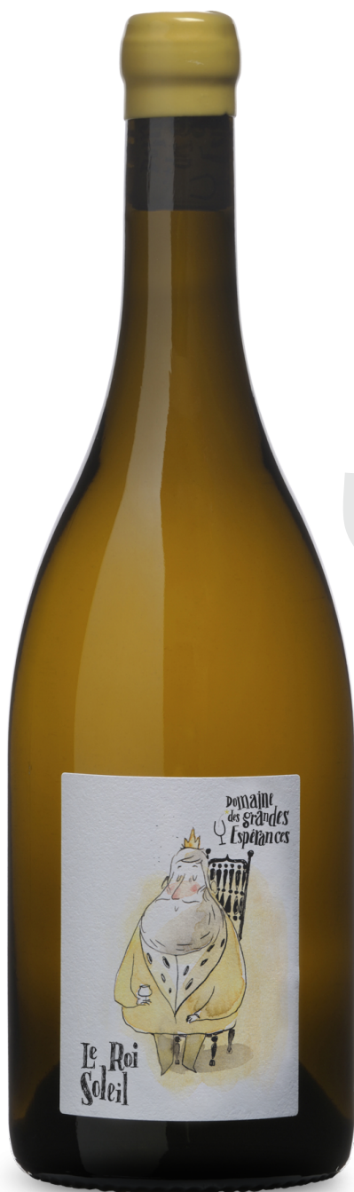
Touraine 2012 « Le Roi Soleil » Domaine des Grandes Espérances